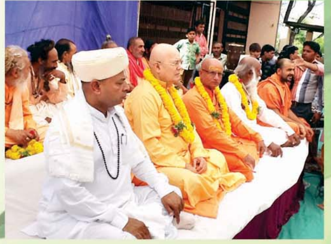
નારદીપુર બીલેશ્વરમહાદેવની પુનઃપ્રતિષ્ઠા પ્રસંગે સંત સમાગમ, તા. ૨૪-૫-૨૦૧૪