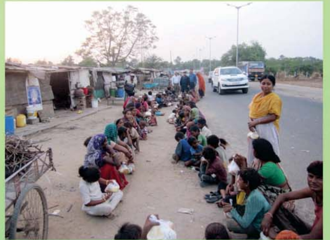
શિવાનંદ આશ્રમ દ્વારા દર મહિનાની ૩, ૮ અને ૨૪મી તારીખે નારાયણ સેવા (આ મહિનામાં શીખંડ-પૂરી અને રસ-પૂરીનું જમણ થયું)