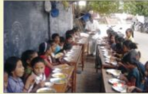
નારાયણ સેવાના ભાગરૂપે આંબાવાડી વિસ્તારમાં પીતાના વ્યવસાયની જગ્યા અને ફૂટપાથ ઉપર ગરીબ વિદ્યાર્થીઓ માટે ચાલતા અભ્યાસ વર્ગમાં ભોજન પ્રસાદ પીરસતા કાર્યકરો