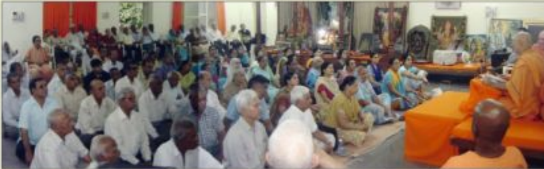
શ્રી શંકરાચાર્ય રચિત "આત્મ-પદકથા" ઉપર તા. ૧૬-૦૭-૧૧ થી સાત દિવસીય પૂજ્ય સ્વામીજીની વ્યાખ્યાનશ્રેણી આશ્રમ ખાતે સંપન્ન થઈ