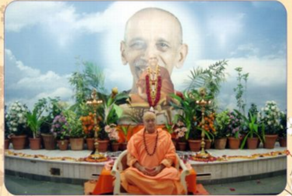
પૂજ્ય સ્વામી વિવાનંદજી મહારાજના મહાસમાધિ (જારાધાના) દિને ગુરુ-વિશ્વ પરંપરાનું પ્રલક્ષ્ય દર્શન સાધ્યમના વિદ્યાનંદ ધ્યાનકૈવલમાં સીને વધું.

વર્ષિક ભાગ્યમ : રૂ. ૧૦૦/- વર્ષ - ૮, અંક - ૯ સપ્ટેમ્બર-૨૦૧૧