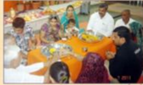
તા. ૨૪-૪-૧૧ના રોજ પૂજ્ય ગુરુદેવના સમર્પિતને ગુરુ પાર્શ્વપૂજન કરતા ભક્તો.