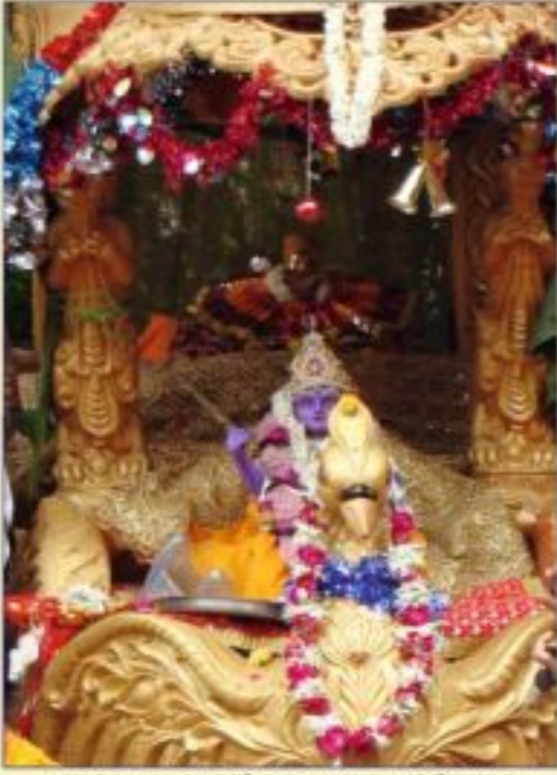
સ્થવાચા - તા. ૩ જુલાઈએ જગન્નાથજી સ્થમાં ઠિરાજમાન સ્થવાચાના શુંગર સ્થનું પરિભ્રમણ