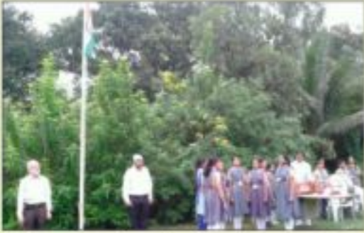
શિવાનંદ આશ્રમ ખાતે ૧૫ ઓગસ્ટે ધ્વજવંદન કાર્યક્રમ યોજાયો. ધ્વજરોહણ મંત્રીશ્રી રાજુવ શાહને હસ્તે કરાવું. વિદ્યાર્થીઓએ વંદેમાતરમ્, રાષ્ટ્રગીત અને દેશભક્તિનાં ગીત ગાયાં