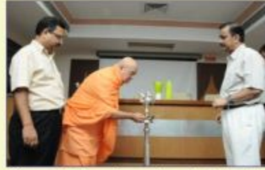
કેડિલા ફાર્માસ્યુટિકલ્સ, ધોળકા રોડ ખાતે કંપનીના ઉચ્ચ અધિકારીઓના તાલીમવર્ગનું ઉદ્ઘાટન કરતા પૂજ્ય સ્વામીજી