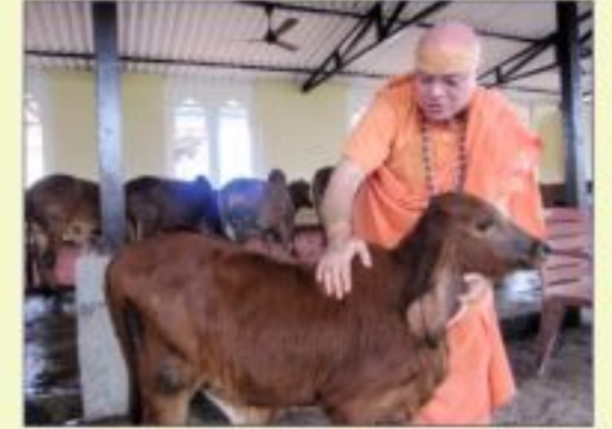
લોનાવાલા ખાતે યોજાયેલ પાંચ દિવસની સાધના શિબિરમાં મંચસ્થ પૂજ્ય સ્વામીજી, નીચેના આયાચિત્રમાં પૂજ્ય સ્વામીજીના સન્નિધ્યમાં ચોખાસન કરતા શિબિરચાલીઓ. શિબિરના સ્થળ નારાયણીધામ ખાતેની ગીરાજાળમાં વાહરડાંને વહાવ કરતા પૂજ્ય સ્વામીજી. ગીરાજાળમાં પૂજ્ય સ્વામીજીએ ઘણો સમય ગૌવંશ સામે બેસી તેના રક્ષણ માટે આરાધના કરી.