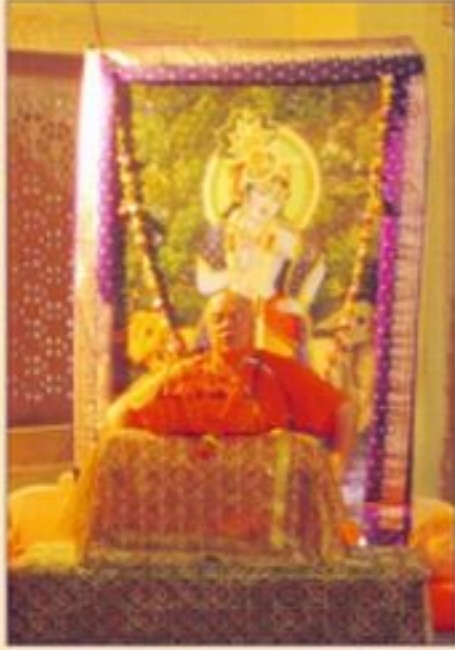
વિવાનંદ સાધુજીનાં પૂજ્ય સ્વામીજીની તા. ૧૨-૮-૧૧ થી ૨૮-૮-૧૧ સુધી ભાગવત દાસમ સ્કંધ કથાનું આયોજન કરવામાં આવ્યું.