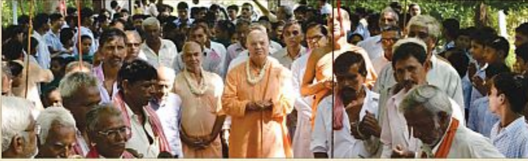
ગૂજરાત વિદ્યાપીઠ દેશલી ખાતે પૂજ્ય સ્વામીજી અને સંતોનું ભાવભીનું ઉખાસભર સ્વાગત (૨૭-૯-૨૦૧૨)