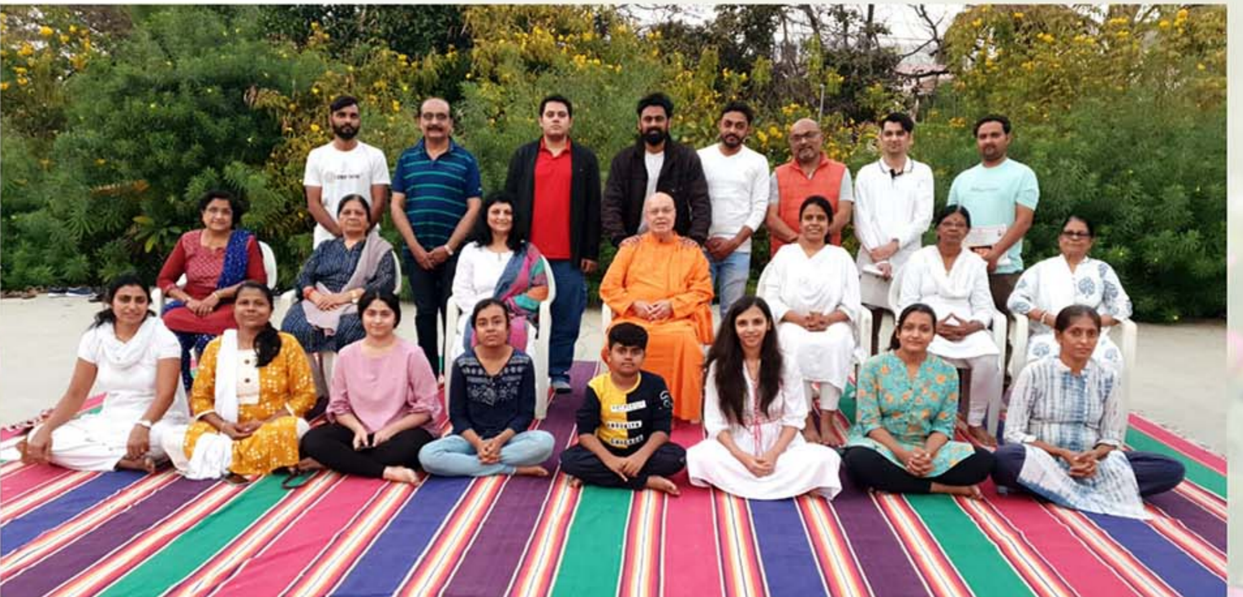
શિવાનંદ આશ્રમ ખાતે રેઈકી - પૌરમો ફર્સ્ટ ડિગ્રી સેમિનાર, તા. ૧૩-૨-૨૦૨૧