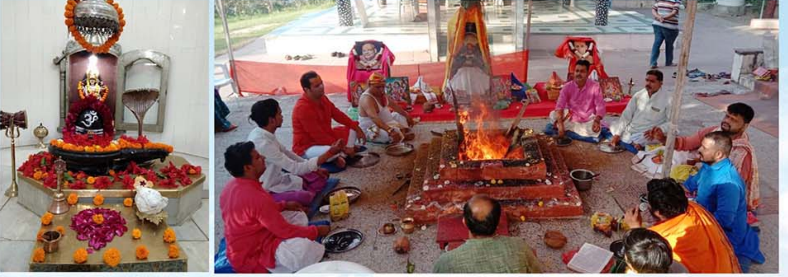
શિવાનંદ આશ્રમ ખાતે હોમાત્મક લઘુરુદ્ર. તા. ૨૮-૨-૨૦૨૧