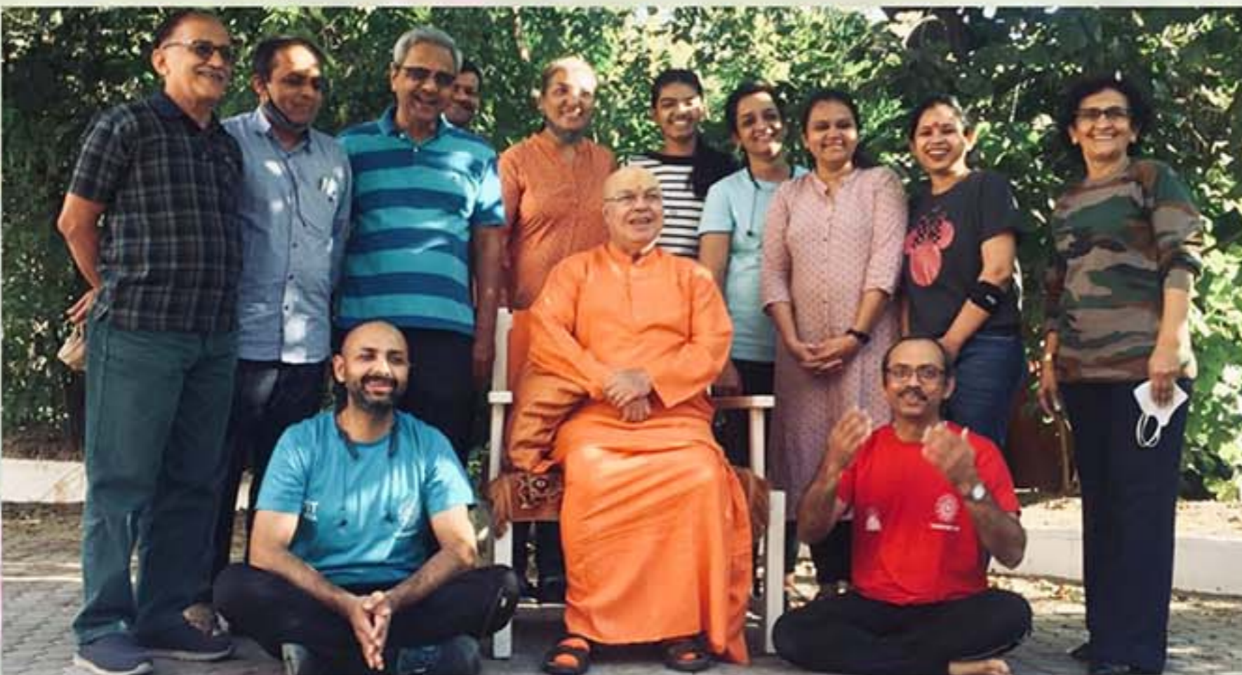
શંખપ્રક્ષાલન ક્રિયા પછી નિયમાનુસાર બ્રહ્મખીચડી અને કાઢાનો (સોમરસ-અંજીર, જરદાળુ, કાળી મોટી દ્રાક્ષ, સૂકાં બોર, આદુ, કાળાં મરી, ગોળ, તુલસીનાં પાનનો ઉકાળો) ભોજનપ્રસાદ પીરસવામાં આવ્યો. પૂજ્ય સ્વામીજીના સાંનિધ્યમાં યોગનિકેતન સ્કૂલ, વડોદરા, ભુજ, ભરૂચ અને સુરતના યોગપ્રેમીઓ. તા. ૭-૨-૨૦૨૧